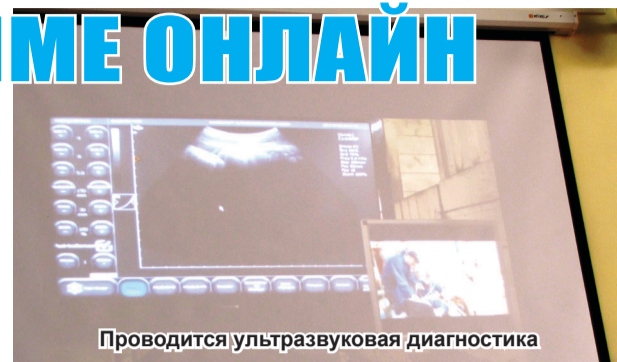
Проводится ультразвуковая диагностика

подобные мастер-классы с привлечением не только иностранных, но и отечественных учёных, позволит повысить уровень знаний студентов и преподавателей высших учебных заведений сельскохозяйственного