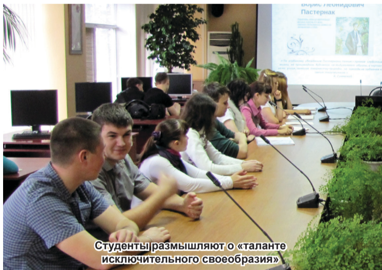
Студенты размышляют о «таланте исключительного своеобразия»