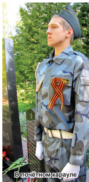
В почётном карауле

них - герои, навсегда оставшиеся на полях сражений. Вечная им память! Среди них - орденосцы, кто вернулся домой с победой и затем строил новую, мирную жизнь. Вечная слава победителям - тем, кого уже нет с нами, и тем, кто и сейчас в строю. Самые теплые слова и пожелания в этот день - членам