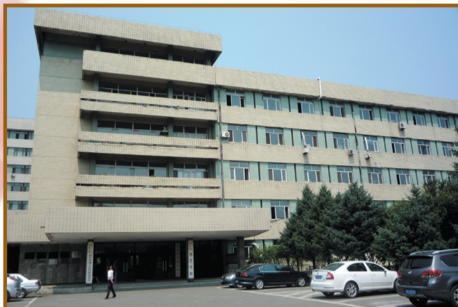
Здание факультета садоводства Харбинского Северо-Восточного аграрного университета