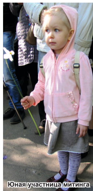
Юная участница митинга

Настроение собравшимся ещё больше подняли ансамбль русской песни Брянской ГСХА «Бабкины внуки», исполнивший